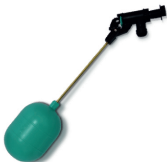
FLOTANTE DE 1/2