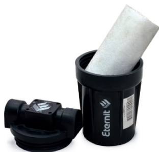
FILTRO DE SEDIMENTOS*